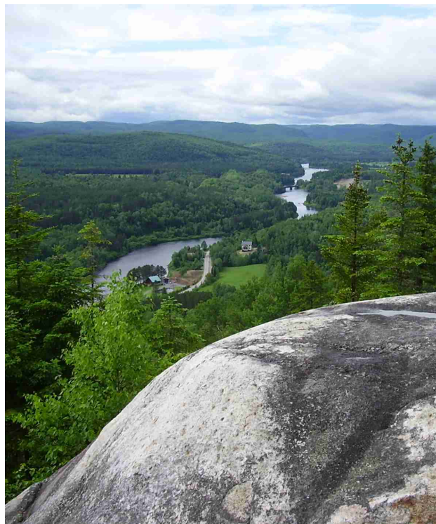
Vue sur la rivière Batiscan

Le sentier longe d'abord la rive ouest de la rivière Batiscan, permettant d'observer plusieurs chutes dont celle du Neuf, haute d'une dizaine de mètres. On peut l'admirer de près grâce à une passerelle. Après la traversée du pont de la rivière Batiscan, le sentier longe la rive est sur quelques centaines de mètres pour ensuite croiser la route 367 à trois reprises avant de s'aventurer dans la forêt mixte laurentienne. La montée se fait progressivement vers le sommet du mont Otis (325 m) où on a une vue époustouflante de 180° sur la vallée de la Batiscan et les montagnes environnantes. Le sentier descend ensuite vers le lac des Pins, traverse des érablières, des forêts de conifères et des secteurs en régénération, effectue quelques montées et descentes d'une centaine de mètres de dénivelé. Il traverse plusieurs petits ruisseaux et les rivières des Pins et à Peine sur des passerelles, puis croise le portage entre les lacs Carillon et Montauban avant une dernière ascension qui mène à la jonction avec la continuité du Sentier national dans le Parc naturel régional de Portneuf.